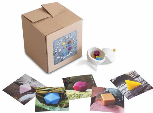
Ein Kartenset zu den 5 Elementen